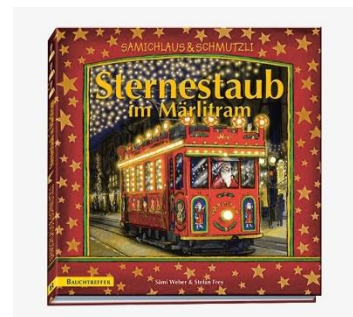
Spielzeug-Holzbahn (39.90 CHF), DillySocks für die ganze Familie (ab 12.90 CHF), «Sternestaub» Kinderbuch (24.00 CHF) und vieles mehr im Märli tram-Design