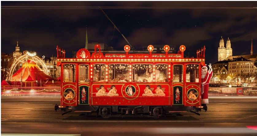
Das nostalgische Jelmoli Märli tram ist auch in diesem Jahr wieder in Zürich unterwegs.

Das nostalgische Jelmoli Märli tram gehört seit jeher zu Jelmolis Geschichte. Seit 1958 fährt das älteste Fahrzeug der VBZ-Flotte während der Adventszeit durch die Stadt und verbreitet weihnachtliche Stimmung. Festlich beleuchtet ist es auf seiner legendären Route, beginnend am Zürcher Bellevue über den Limmatquai, Central und die Bahnhofstrasse zurück zum Startpunkt, unterwegs. Rund 20 Minuten dauert die Fahrt, wobei der Samichlaus persönlich am Steuer sitzt.