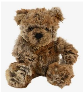
Jelmoli Charity-Bär von Steiff, 34.90 CHF

Zudem nimmt Jelmoli in diesem Jahr erneut am Giving Tuesday teil und setzt damit ein Statement gegen den Black Friday und für bewussten Konsum. Wie bereits die letzten beiden Jahre spendet Jelmoli vom Freitag, 26. November bis Sonntag, 28. November 2021 für jeden Einkauf ab 50 CHF einen Betrag von CHF 5 CHF an einen ausgewählten Charity Partner. Während der konsumstärksten Zeit des Jahres setzt Jelmoli so ein Zeichen gegen over consumption und für Solidarität und soziales Engagement. Dieses Jahr kommt der Erlös ebenfalls dem Züriwerk zugute.