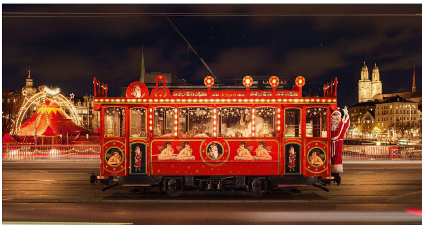
Das nostalgische Jelmoli Märli tram ist auch in diesem Jahr wieder in Zürich unterwegs.

Das nostalgische Jelmoli Märli tram gehört seit bald 65 Jahren zu Jelmolis Geschichte. Seit 1958 fährt das älteste Fahrzeug der VBZ-Flotte während der Adventszeit durch die Stadt und verbreitet weihnachtliche Stimmung. Festlich beleuchtet ist es auf seiner legendären Route, beginnend am Zürcher Bellevue über den Limmatquai, Central und die Bahnhofstrasse zurück zum Startpunkt, unterwegs. Rund 20 Minuten dauert die Fahrt, wobei der Samichlaus persönlich am Steuer sitzt.