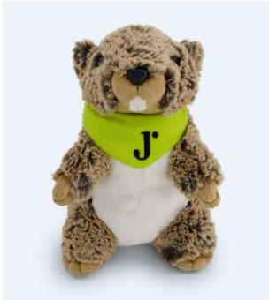
Plüsch-Moli, 39.90 CHF

Zudem nimmt Jelmoli in diesem Jahr bereits zum vierten Mal in Folge am Giving Tuesday teil und setzt damit ein Statement gegen den Black Friday und für bewussten Konsum. Am Freitag, 25. November 2022 spendet Jelmoli für jeden Einkauf ab 50 CHF einen Betrag von CHF 5 CHF an Insieme21. Während der konsumstärksten Zeit des Jahres setzt Jelmoli so ein Zeichen gegen over consumption und für Solidarität und soziales Engagement. Der Erlös wird am Giving Tuesday, 29. November 2022 dem Verein übergeben.